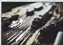
Der er kælet for detaljerne i det landskab, medlemmerne bygger op. Der er sten ved sporene, som sirligt er limet på.

Af Dorthe Knudsen Tlf. 7211 4386, dkn@jv.dk