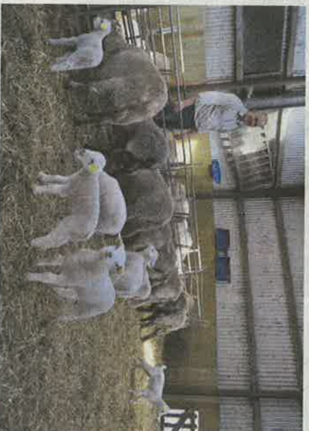
Lammene, der er fra begyndelsen april, er trekvart Texel og en kvart gottlandsk pelsfår. Det giver nemme dyr med god kødfordeling.