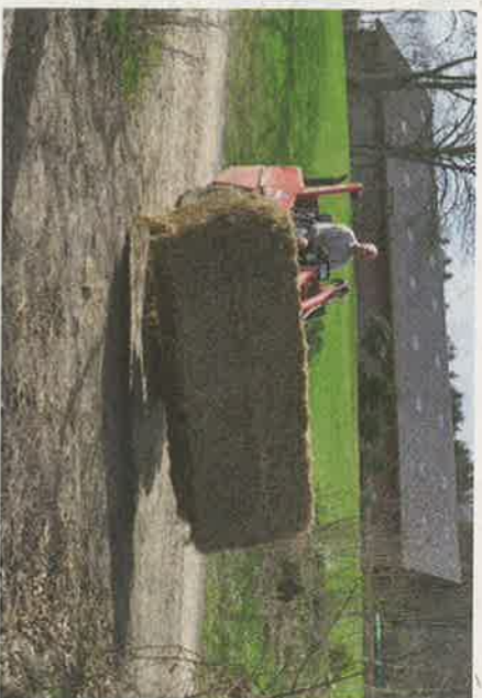
Minilæsseren klarer nemt transporten af store halmballer, der skal køres ind i stalden til får og stude.