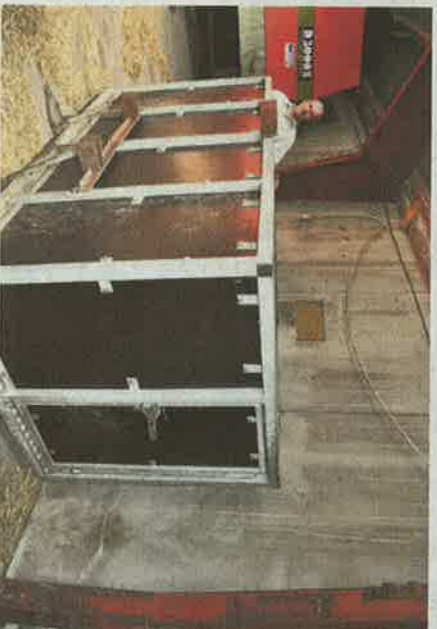
Grisekassen er købt brugt hos en nabo. Den bruges til transport af både får og tyrekalve.