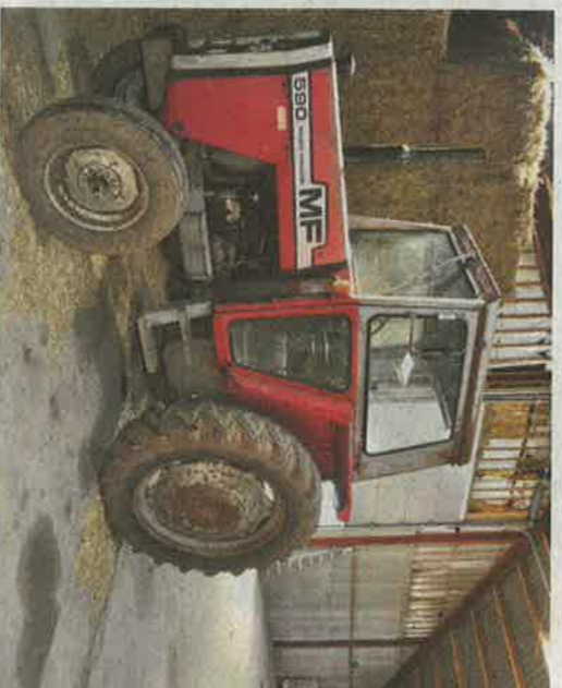
Traktoren, en Massey Ferguson, hørte med til gården.

Kassen kan også rumme syv-otte nyfødte tyrekalve, der køres hjem, hvorefter dyrlægen kastrer dem, så de bliver til stude, der går på naturarealer og fædes op til slagting