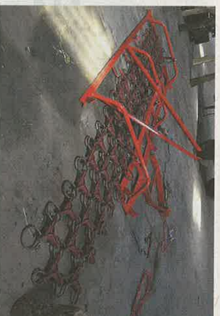
Græsmarksharven er god til at udjævne muldvarpeskud, så det bliver nemmere at køre på arealerne. Denne harve er købt brugt, men har for nylig modtaget repareres hos smeden, så den stort set lige så godt kunne være købt ny, forfatter Finn Poulsen