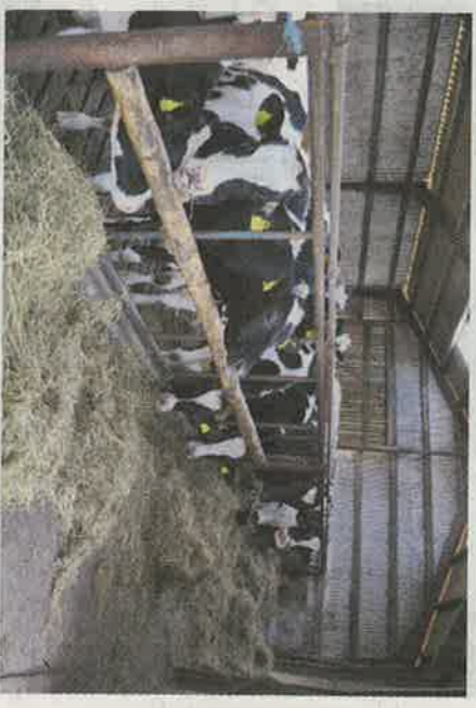
Studene er sortbrogede Holstein-Friesere, der her i slutningen af april kommer ud på græs på naturarealer.