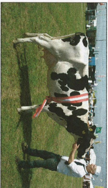
Traditionen tro var konkurrencen intens i forbindelse med kåringen af de bedste køer. Skuets bedste SDM-ko blev denne ældre ko fra besætningen fra Statsfængslet Renbæk, Skærbæk.