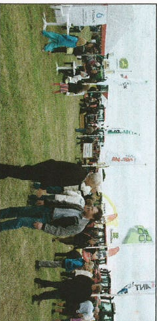
Der var masser af folk på gårsdagens dyrskue i Ribe.

AF JOHN ANKERSEN Antallet af udstillere var større end nogensinde, og dyrskueringen var fyldt med topdyr, da Ribe Dyrskue fredag løb af stabeln på Hovedengen i Ribe.