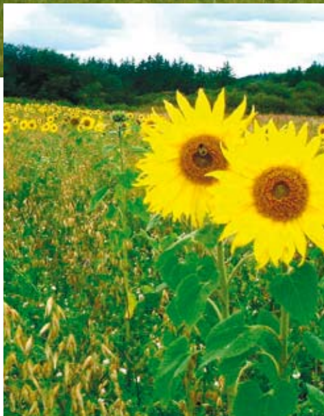
Vildtstribe med blandede foderplanter.