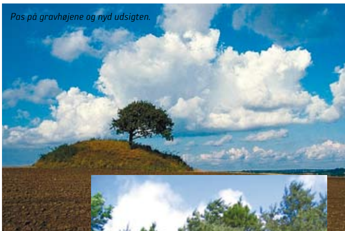
Pas på gravhøjene og nyd udsigten.