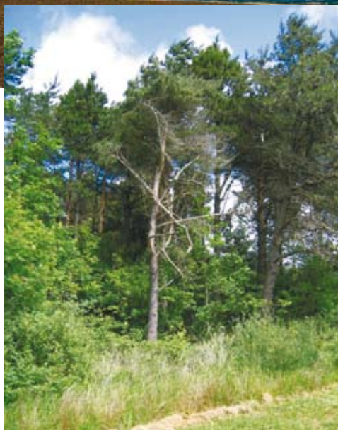
Gammel nåle- og løvskov.