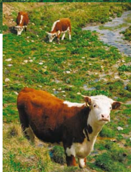
Ammekvæg på græs.