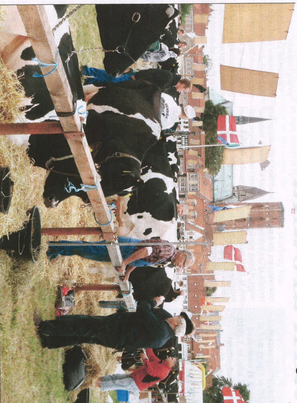
Masser af dyr, udstillere og forhåbentlig rigtig mange besøgende, når Ribe Dyrskue løber af stablen på fredag.